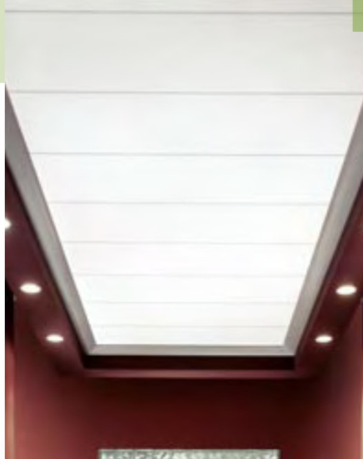
Optima Open Plan Prancha com perfil INTERLUDE® XL de 9/16"